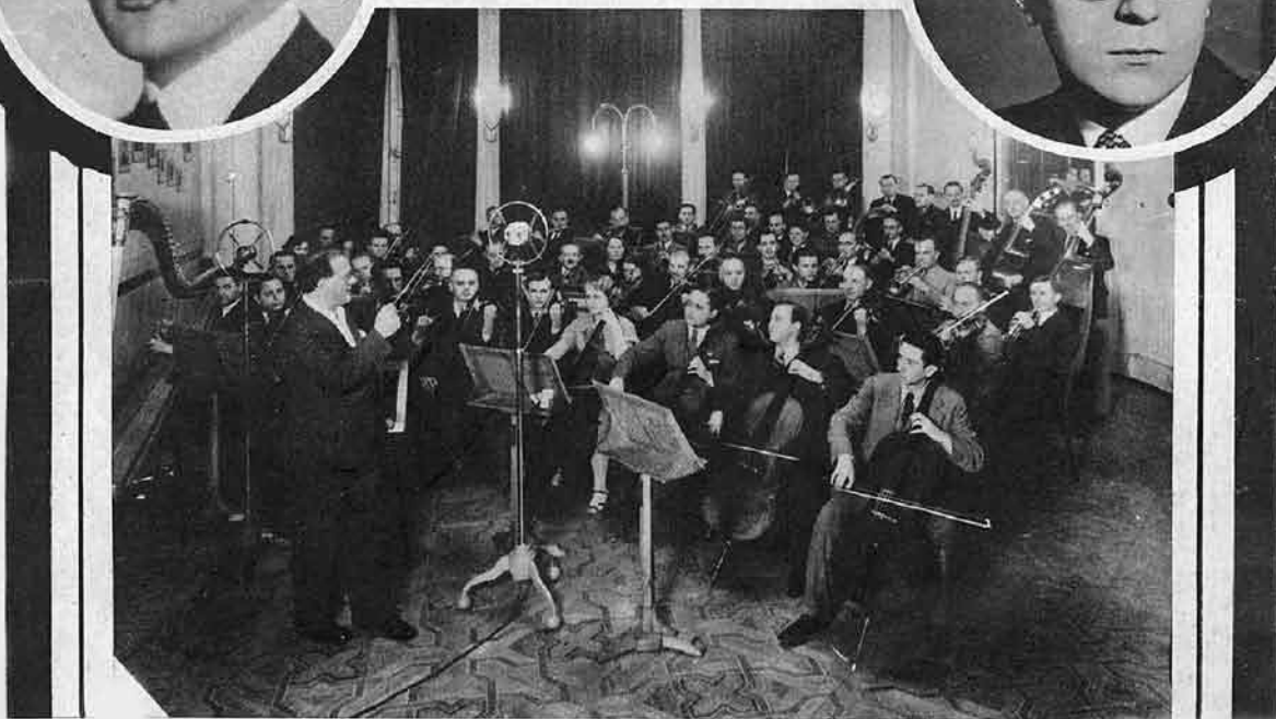
52-osobowa własna orkiestra symfoniczna Polskiego Radja w wielkim studjo